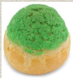
Bánh Su Kem Trà Xanh Green Tea Choux