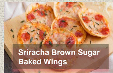
Sriracha Brown Sugar Baked Wings