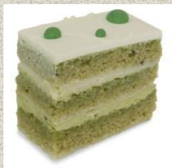
Bánh Kem Tầng vị Trà Xanh Green Tea Opera Cake