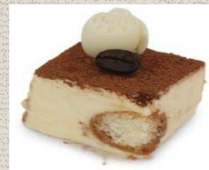
Bánh Tiramitsu Tiramitsu