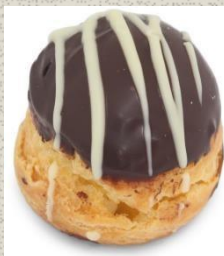
Bánh Su Kem Sô-cô-la Chocolate Choux