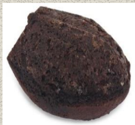
Bánh Madeleine Sô-cô-la Chocolate Madeleine