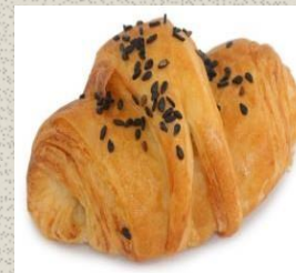
Bánh Sừng Bò Đậu Đỏ Red Bean Croissant