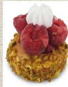
Bánh Phúc Bồn Tử Raspberry Cake