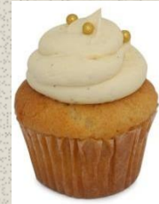
Bánh Cupcake vị Vani Vanilla Cupcake