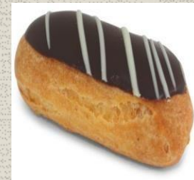
Bánh Eclair Sô-cô-la Chocolate Eclair