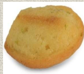
Bánh Madeleine vị Chanh Lemon Madeleine