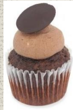
Bánh Cupcake vị Chuối và Sô-cô-la Chocolate Banana Cupcake