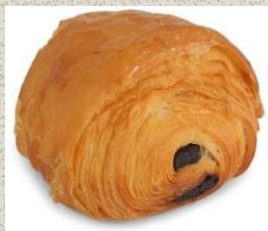
Bánh Sừng Bò Sô-cô-la Chocolate Croissant