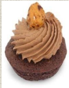
Bánh Brownie Chocolate Brownies Mousse Cake