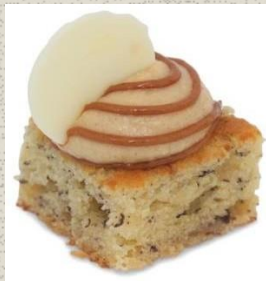
Bánh Mousse vị Chuối và Ca-ra-men Banana Caramel Mousse Cake