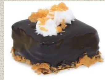
Bánh Mousse Sô-cô-la Royal Chocolate Mousse Cake