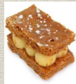
Bánh Millefeuille Millefeuille