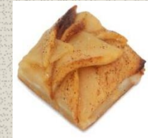
Bánh Tart vị Táo Apple Tart