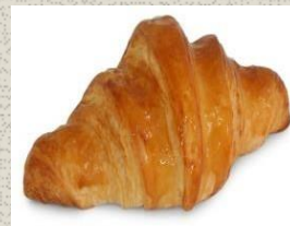
Bánh Sừng Bò Plain Plain Croissant