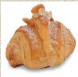
Bánh Sừng Bò Hạnh Nhân Almond Croissant