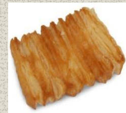
Bánh Palmier Palmier