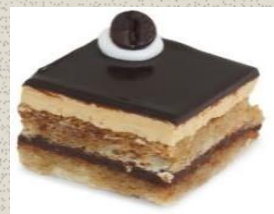
Bánh Kem Tầng vị Cà Phê Coffee Opera Cake