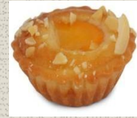
Bánh Tart vị Đào Peach Tart