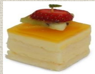
Bánh Mousse vị Chanh Dây Passion Fruit Mousse Cake