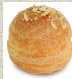
Bánh Su Kem Hạnh Nhân Almond Choux