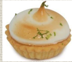
Bánh Tart vị Chanh Lemon Tart