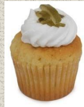
Bánh Cupcake vị Chanh Lime Cupcake