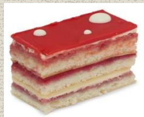
Bánh Kem Tầng vị Phúc Bồn Tử Red Opera Cake