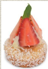
Bánh Dâu Tây Strawberry Cake