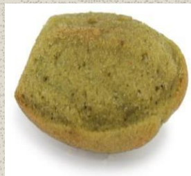
Bánh Madeleine Trà Xanh Green Tea Madeleine