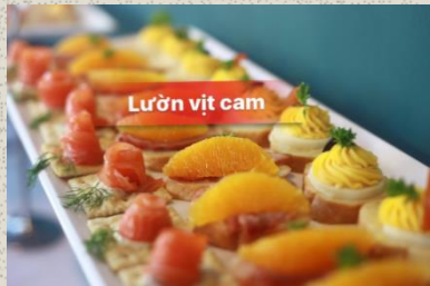
Lườn vịt cam