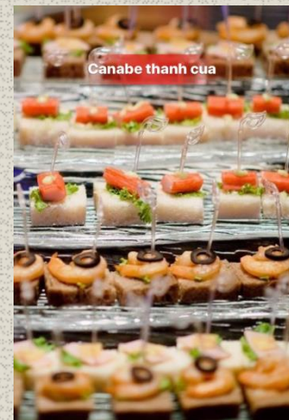
Canape thanh cua