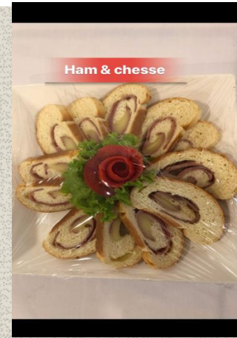
Ham & chesse