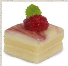
Bánh Cheese Phúc Bồn Tử Raspberry Cheese Cake