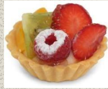
Bánh Tart Hoa Quả Fruit Tart