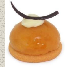
Bánh Xoài Mango Tatin